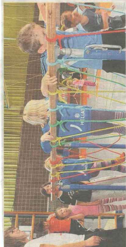
Gleichgewicht war am Barren gefragt. Das Turngerät musste über Seile durchquert werden.