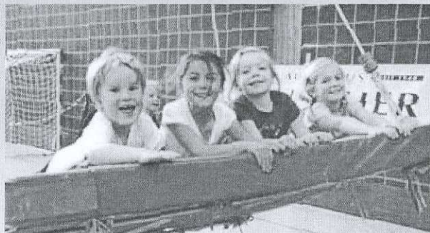
Viel Spaß hatten die Kids auch an der Mattenschaukel

Unter dem Motto "Kinder tollen, toben, spielen...." ließen Ende Oktober und Anfang November in Kempten und Sonthofen über 700 Kids ihrem Bewegungsdrang freien Lauf. Für die Kinder von 4-10 Jahren war ein toller Bewegungs- und Spielparcours mit unterschiedlichen Großgeräten in den Sporthallen aufgebaut. Dadurch entstanden attraktive Abenteuerlandschaften, in denen sie nach Lust und Laune toben und spielen konnten. Die nötigen Tipps und Hilfestellungen erhielten sie dabei von Übungsleitern des TV Jahn Kempten bzw. des TSV Sonthofen. "Unser Ziel ist es, dass die Kinder auf spielerische Weise für sportliche Aktivitäten begeistert werden und vor allem Spaß an der Bewegung haben", so die Organisatoren Reinhard und Thomas Gansert vom SpoSpiTo-Team. Wenn alle Sponsoren und Helfer auch 2013 den einmaligen Event unterstützen, können sich alle Kids und ihre Eltern im nächsten Jahr wieder auf ausgelassene Stunden in den Turnhallen freuen.