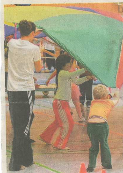
Beim Kinderaktionstag in Sonthofen wird den Teilnehmern auch am Sonntag wieder viel geboten.

Den Kindern werden Bewegungsmöglichkeiten aller Art wie Klettern, Springen, Schaukeln, Schwingen, Rollen und Balancieren angeboten. „Wir möchten, dass alle Kinder Spaß an der Bewegung haben und auf spielerische Weise für sportliche Aktivitäten begeistert werden“, sagen die Organisatoren Reinhard und Thomas Gansert vom SpoSpiTo-Team. Zur Wahl stehen zwei Termine: von 11 bis 13 und von 14 bis 16 Uhr.