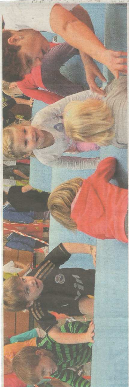
Über Rollen ging es beim 2. Kinderaktionstag in der Sonthofer Allgäu-Halle. 300 Mädchen und Buben hatten viel Spaß bei der vom TSV Sonthofen organisierten Veranstaltung.