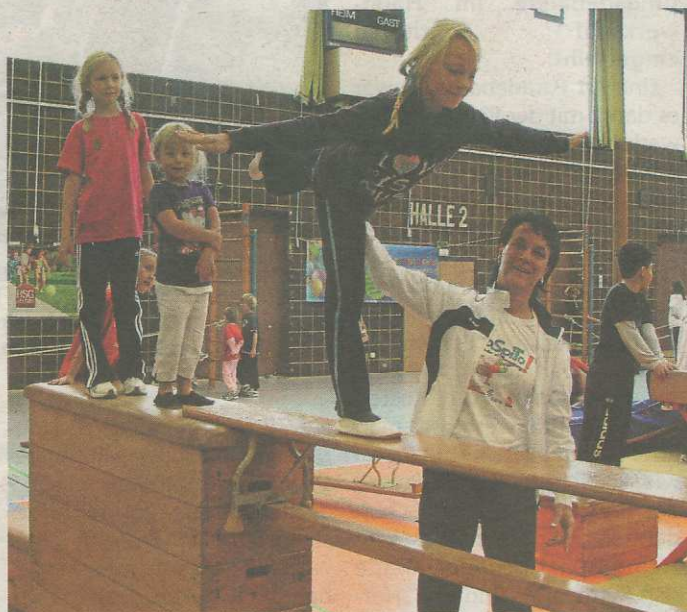
„SpoSpiTo“ bringt Kinder in Bewegung.

Zwei jeweils zweistündige „Runden“ werden am Sonn-