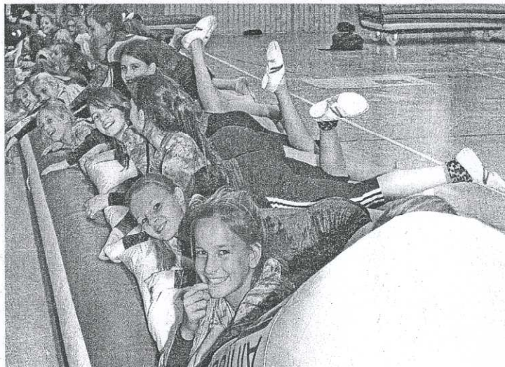
Die Bahn lässt sich auch als übergroße „Luftmatratze“ nützen – sehr zur Freude der Kinder beim TV Jahn Kempten.