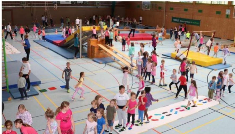
Kinderaktionstag „SpospiTo“: Der TV Immenstadt lädt auch in diesem Jahr zum großen Tobetag ein.

Davon träumt jedes Kind: Toben erwünscht! Dieses Motto gilt am Samstag, 5. April, in der Julius-Kunert-Halle in Immenstadt (Allgäuer Straße 15) von 11 bis 13 Uhr sowie von 14 bis 16 Uhr. Auch in diesem Frühjahr veranstaltet der TV Immenstadt wieder einen großen Kinderaktionstag „SpospiTo – bringt Kinder in Bewegung!“