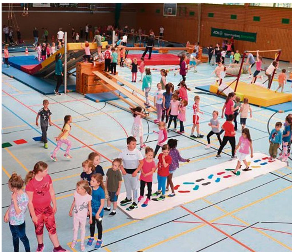
Kinderaktionstag „SpoSpiTo“: Der TV Immenstadt lädt auch in diesem Jahr zum großen Tobetag ein.

Sporteln, Spielen, Toben am 5. April in Immenstadt