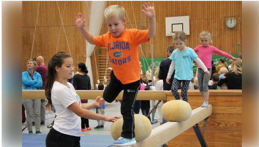
Kinderaktion- & Tobetag in der Julius-Kunert-Halle

Kinderaktion- & Tobetag in der Julius-Kunert-Halle Davon träumt jedes Kind: Toben erwünscht! Dieses Motto gilt am Samstag, 5. April, in der Julius-Kunert-Halle in Immenstadt (Allgäuer Straße 15) von 11 bis 13 Uhr sowie von 14 bis 16 Uhr. Auch in diesem Frühjahr veranstaltet der TV Immenstadt wieder einen großen Kinderaktionstag „SpoSpiTo – bringt Kinder in Bewegung!“.