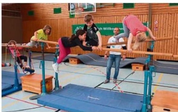
Eine imaginäre Schlucht überwinden: Beim Kinderaktionstag werden viele Stationen für die Kinder aufgebaut, so dass sie sich nach Herzenslust austoben können.

Gefördert von der AOK Kempten-Oberallgäu-Lindau veranstalten der SSV Wildpoldsried bzw. der TV Kempten einen großen Kinderaktionstag „SpoSpiTo – bringt Kinder in Bewegung!“. „Wir bauen mit Sportgeräten einen Bewegungs- und Spieleparcours für Mädchen und Buben im Alter von vier bis zehn Jahren“, erläutert Kerstin Winkler vom SSV Wildpoldsried, die in diesem Jahr den großen Tobetag