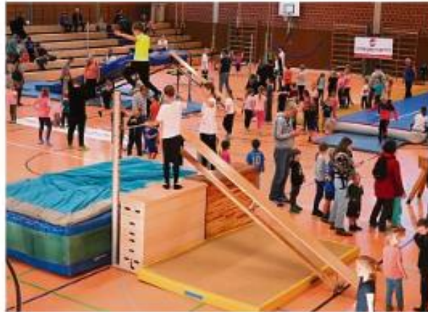
Viel Platz zum Austoben: Über 650 Kinder kamen zu den Tobetagen in Wildpoldsried und Kempten.