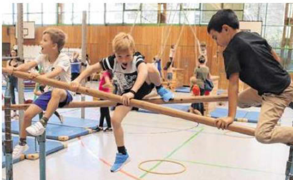
Hochbetrieb herrschte auch am Hexenbarren. Die Kinder tobten sich beim Aktionstag „SpoSpiTo“ nach Herzenslust aus.

i Fotos von der Veranstaltung unter www.spospito.de