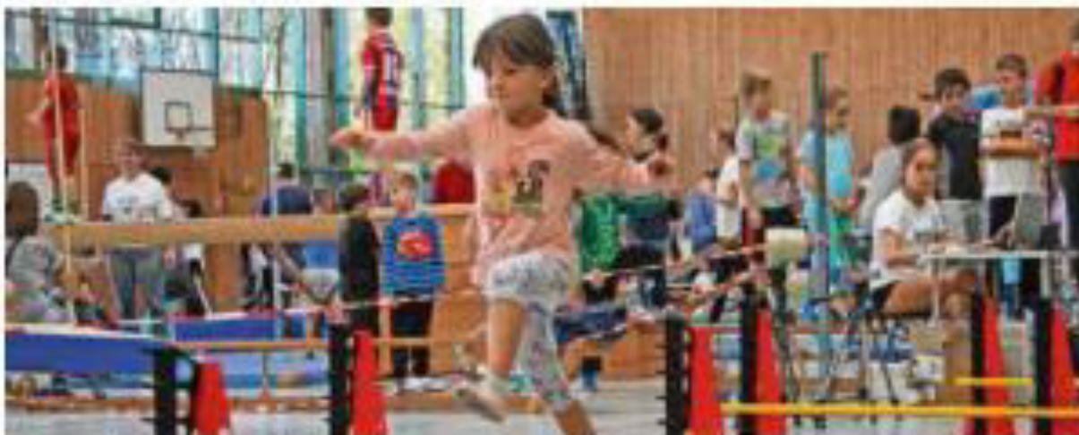
An verschiedenen Stationen können sich die Kinder austoben. Zum Beispiel beim Laufen mit elektronischer Zeitmessung.