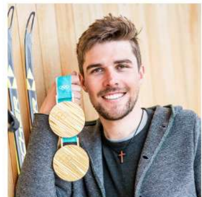
Der erfolgreiche Nordische Kombinierer Johannes Rydzek ist Pate der Allgäuer Tobetage.