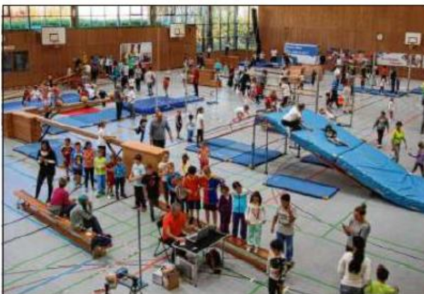
Hier können die Kinder sich austoben und Spaß haben – bei den Aktionstagen werden große Parcours in den Sporthallen aufgebaut.

Termine in Memmingen, Kempten, Sonthofen und Kaufbeuren