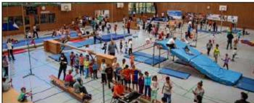
Hier können die Kinder sich austoben und Spaß haben - bei den Aktionstagen werden große Parcours in den Sporthallen aufgebaut.

Termine in Memmingen, Sonthofen, Kempten und Kaufbeuren