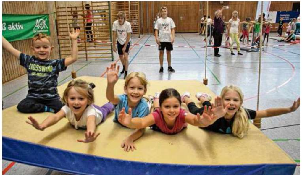
Der „SpoSpiTo“- bringt Kinder in Bewegung.

Eine besondere Attraktion wird sicherlich die Airtrack-Bahn. Das ist eine mit Luft gefüllte Bahn, die an eine überdimensionale Luftmatratze erinnert und auf der man springen kann. „Wir möchten Kinder auf spielerische Weise